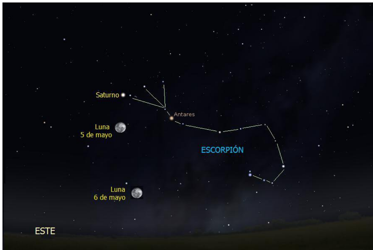
Fig. 1: El cielo visto desde Cochabamba y regiones en el cono sur de Sudamérica el 5 y 6 de mayo a las 21:00 hora local. Observemos la posición de la Luna para ambas fechas.

¿Cómo ubicar a Saturno? Nuestra buena Luna nos ayudará a ubicarlo. El martes 5 de mayo en la noche, la Luna Llena estará cerca del planeta Saturno (a 2.28 grados) (Fig. 1) y si bien el miércoles 6 a la misma hora la Luna estará en otro lugar, nosotros ya habremos ubicado a Saturno para observarlo noche a noche, precisamente en el mes en que se encuentra más cerca de nuestro planeta.