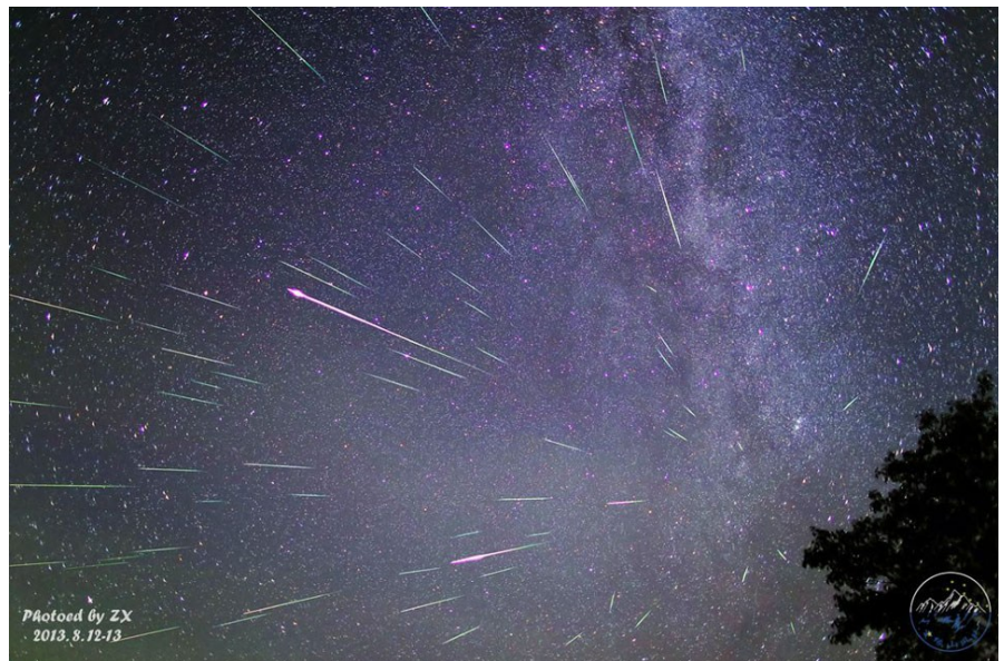
Fig. 1 Actividad de las Perseidas, fotografiada por Xiang Zhan (del planetario de Beijing), se trata de una composición de varias exposiciones tomadas durante un intervalo de 4 horas, entre el 12 y 13 de agosto de 2013. Se aprecia el fenómeno radiante, es decir, el que los meteoros parecen provenir de una región del cielo.

Una característica atractiva de esta lluvia es que muchos de sus meteoros son brillantes y presentan trazos persistentes (llamado estelas) que duran algunos segundos.