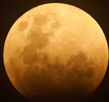
Ilustración 1 Quién sabe, si la Luna no se ve roja y se ve anaranjada, algún especialista en mercadotecnia podría llamarla " Luna Fanta ".

El artículo en cuestión, menciona que "...se dieron de forma simultánea: una Superluna, una Luna de sangre, una Luna azul y un eclipse lunar"