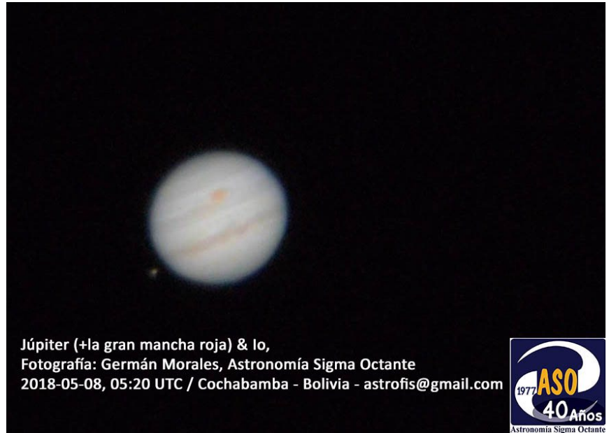
Júpiter (+la gran mancha roja) & Io, 2018-05-08, 05:20 UTC / Cochabamba - Bolivia - astrofis@gmail.com

http://www.astronomia.org.bo/astro/242-OposicionJupiter.pdf