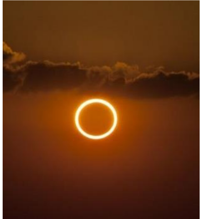
Fig. 2: En un eclipse ANULAR , La Luna no llega a cubrir del todo el disco solar, por lo que deja ver un anillo de luz, llamado “Anillo de fuego”.

Se trata de un eclipse que podrá ser observado casi únicamente en las Américas.